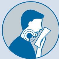
Tos y/o Dolor de garganta