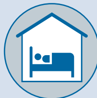
Quedarse en casa mientras se está enfermo; evitar a otros