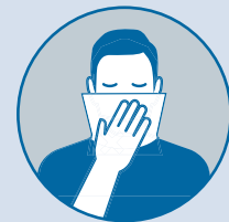
Cubrirse la boca/nariz con un pañuelo desechable o manga al toser o estornudar