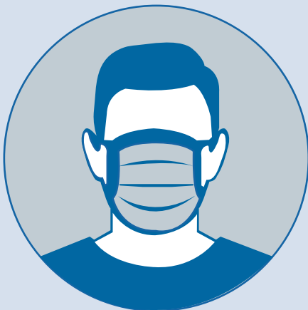
Cubra la boca y la nariz con una cubierta de tela

Visite el siguiente enlace para aprender cómo limpiar y desinfectar una mascarilla dupagehealth.org/630/Face-Covering-Donations