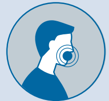
Pérdida reciente del olfato o el gusto

Esta lista no incluye todo. Se han notificado otros síntomas menos comunes, incluidos síntomas gastrointestinales como náuseas, vómitos o diarrea.