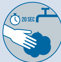
Lavarse las manos con frecuencia

No se quite la mascarilla para hablar con los demás