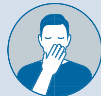
Evitar tocarse los ojos, la nariz o la boca