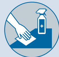
Limpiar y desinfectar objetos y superficies que se tocan con frecuencia